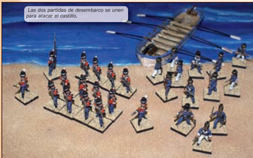
Las dos partidas de desembarco se unen para atacar el castillo.

Los españoles contaban con fuerzas irregulares compuestas por somatenes y migueletes, así como algunos voluntarios, li-