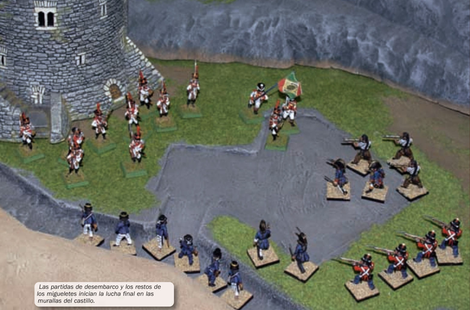
Las partidas de desembarco y los restos de los migueletes inician la lucha final en las murallas del castillo.

2.- Los Migueletes y somatenes: Se presentan por la ficha de unidad de tropa nº 11210, Partida del barón de Eroles, totalizando 12 figuras, con todas sus habilidades especiales. Además utiliza la regla especial de Guerrilleros. 545 puntos en total.