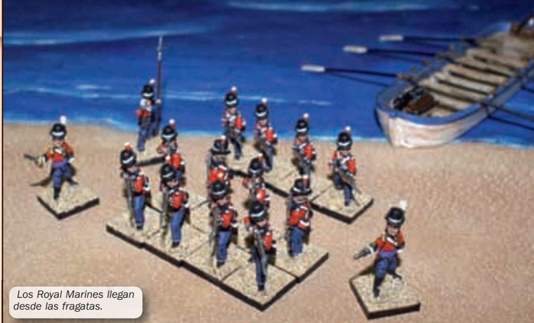
Los Royal Marines llegan desde las fragatas.