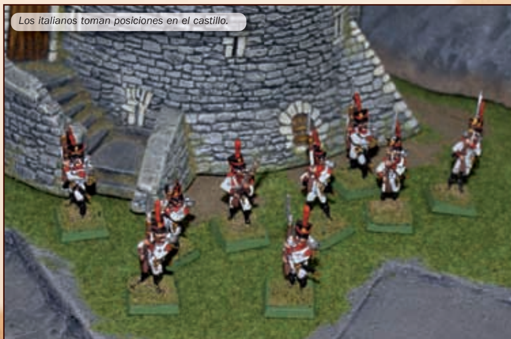
Los italianos toman posiciones en el castillo.

puestos a entregarse a los españoles, sabedores de cual iba a ser su suerte. Al poco rato llegaron los destacamentos ingleses, y tras una breve lucha los italianos enarbolaron bandera blanca, se aproximaron los mandos españoles y británicos a escuchar las solicitudes de los italianos, que eran que éstos rendían el cas-