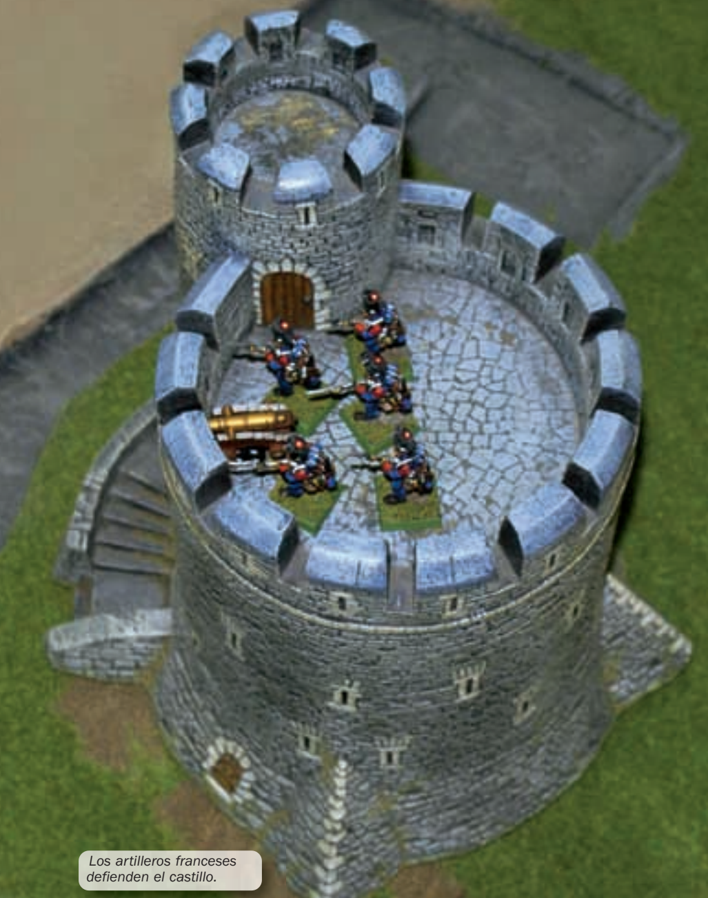
Los artilleros franceses defienden el castillo.