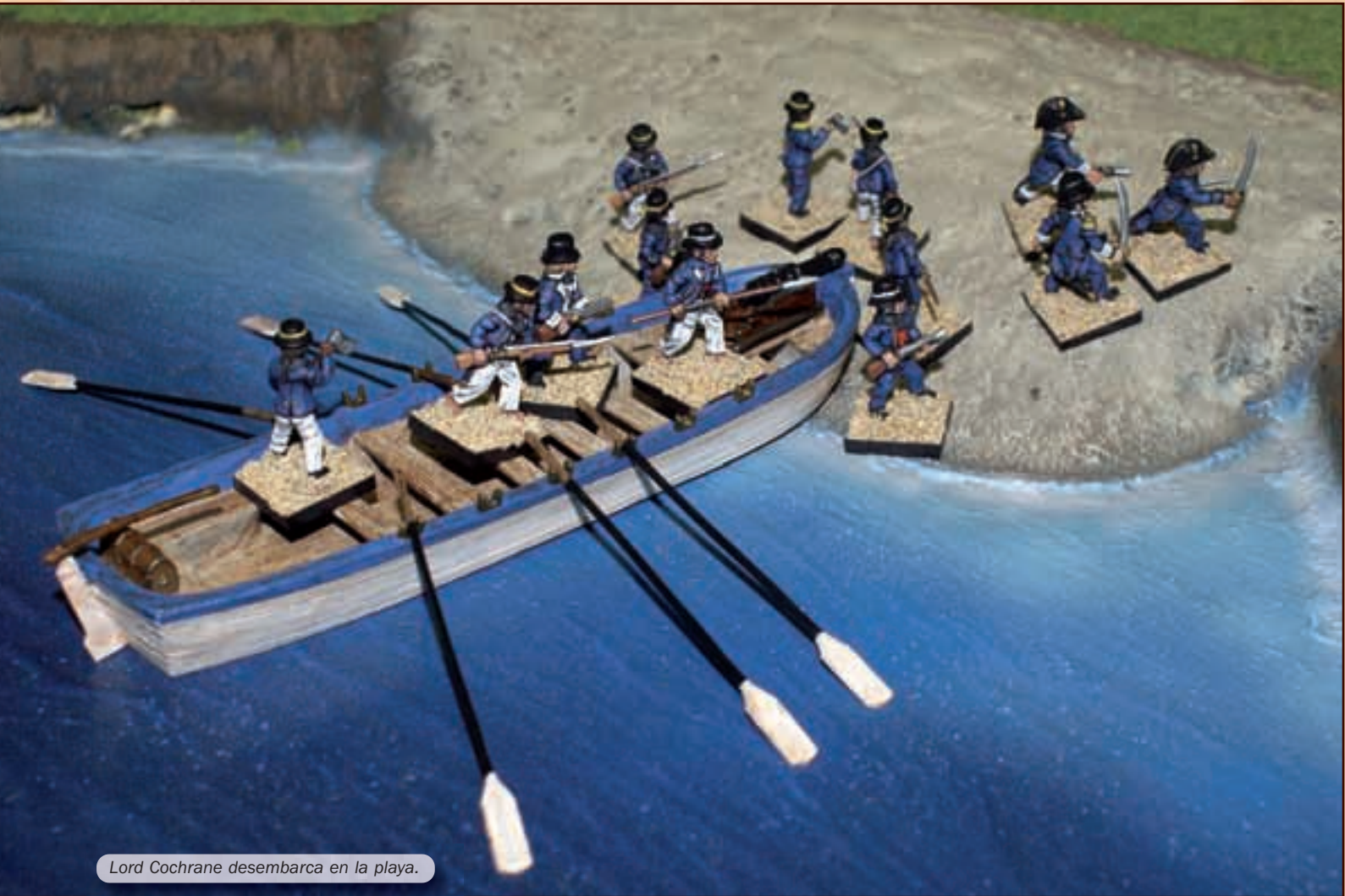
Lord Cochrane desembarca en la playa.