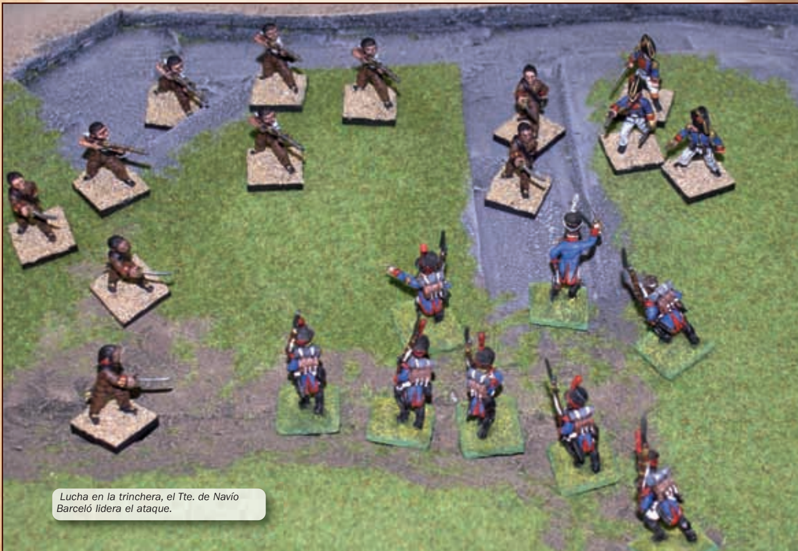
Lucha en la trinchera, el Tte. de Navío Barceló lidera el ataque.

Muchos de los hechos de armas de las guerras napoleónicas y más concretamente de la Guerra de la Independencia, no fueron grandes batallas en las que se desplegaban las tácticas y formaciones divisionarias de la época. Tal es el caso que nos ocupa, estamos ha-