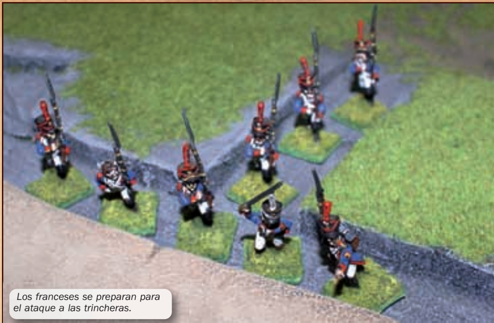
Los franceses se preparan para el ataque a las trincheras.

tillo sólo si se entregaban a los británicos, cosa que así se acordó. Al entrar en el castillo se tomaron 63 prisioneros, incluido un capitán y dos subalternos, que una vez embarcados en los buques británicos fueron llevados prisioneros a Sicilia.